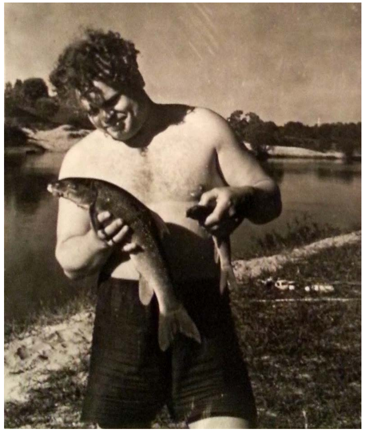
Neries, Žeimenos santaka. 1964 m.