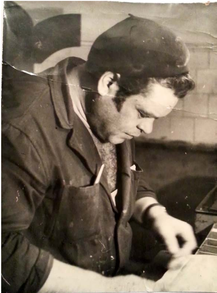
Blizgių gaminimas 1975 m.