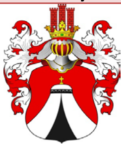
Kisielių giminės herbas.