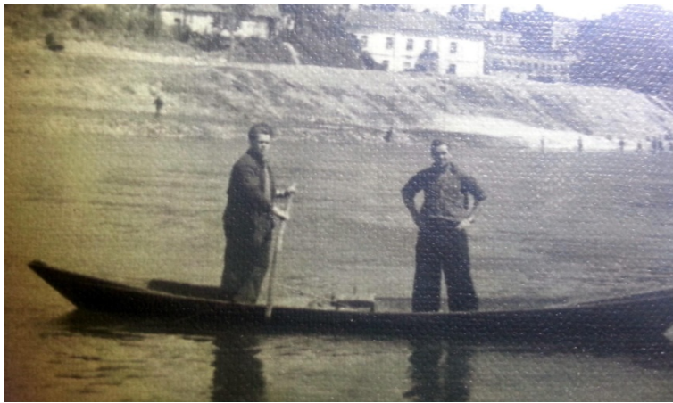
Vilnius 1947 m.