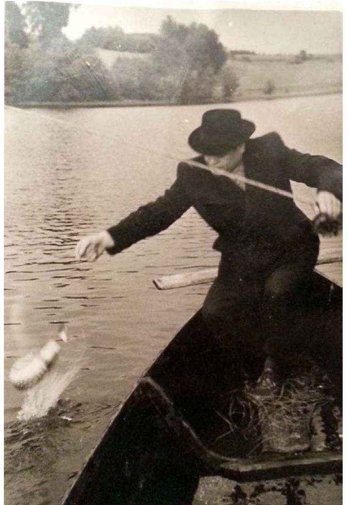
Vilnius, Prie Neries 1951 m.