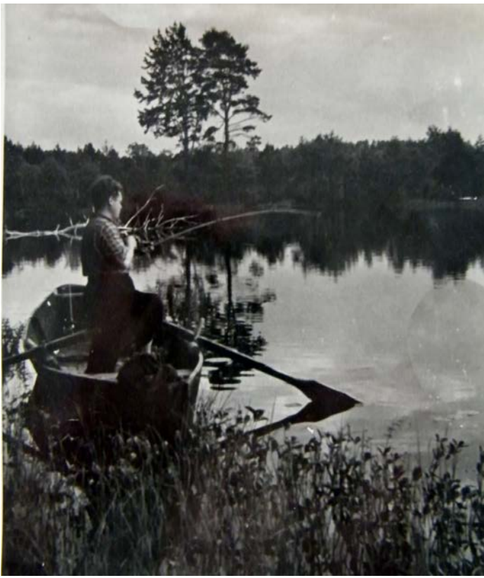
Asalnų ež. 1956 m.