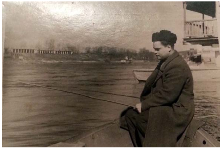
Vilnius, Neries ir Vilnelės santaka. 1950 m. Su lazdyno meškere.