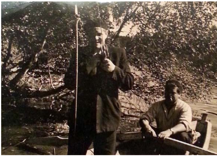
Ir žalčiui patiko blizgė. 1970 m. Lūšių ež. Asalnų ež. Dringiai, 1975m. Santaka.