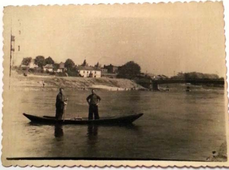
Vilnius 1947 m.