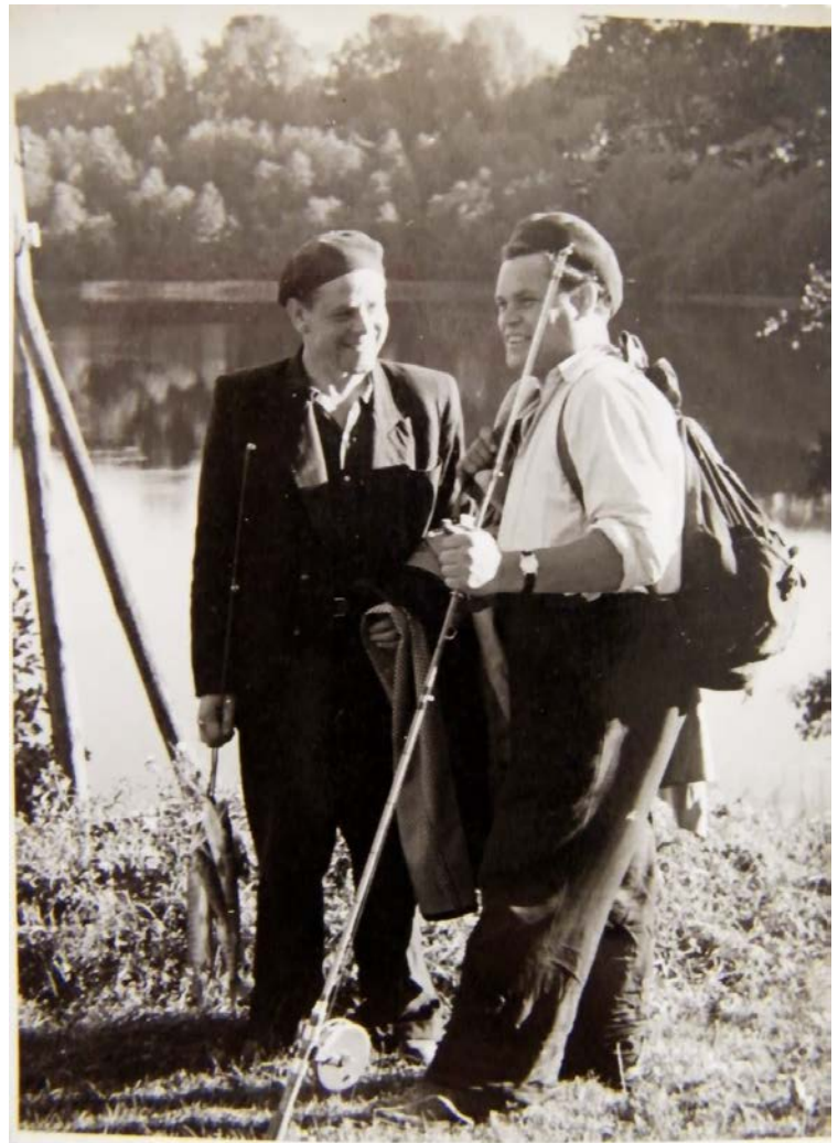
Po žvejybos 1970 m.