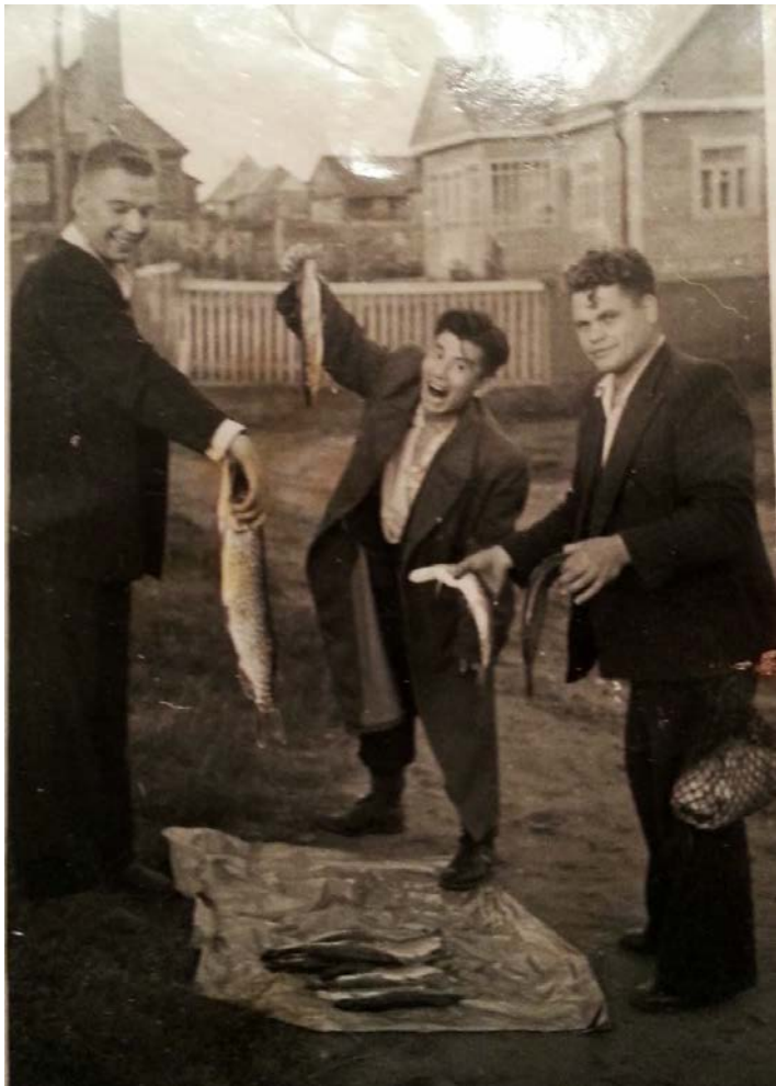
Dubingiai, 1956 m.